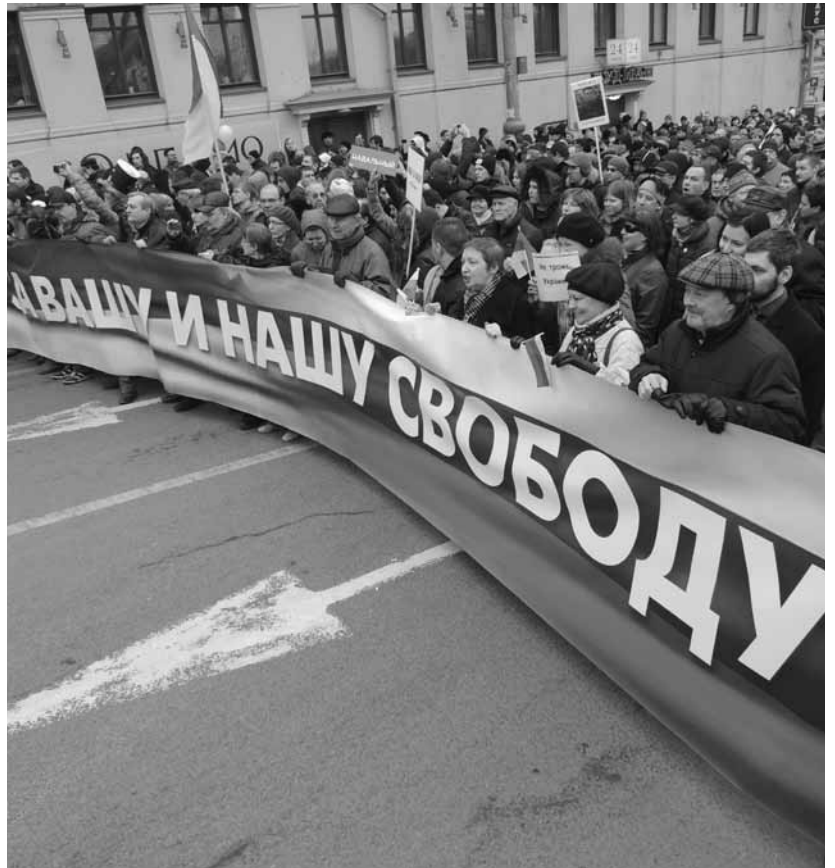
Manifestation pour la paix, Moscou, mars 2014