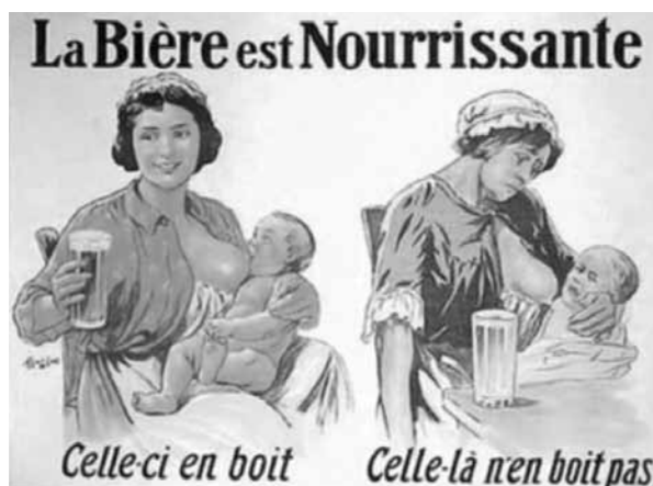
La publicité mensongère et la santé: une idylle qui dure.