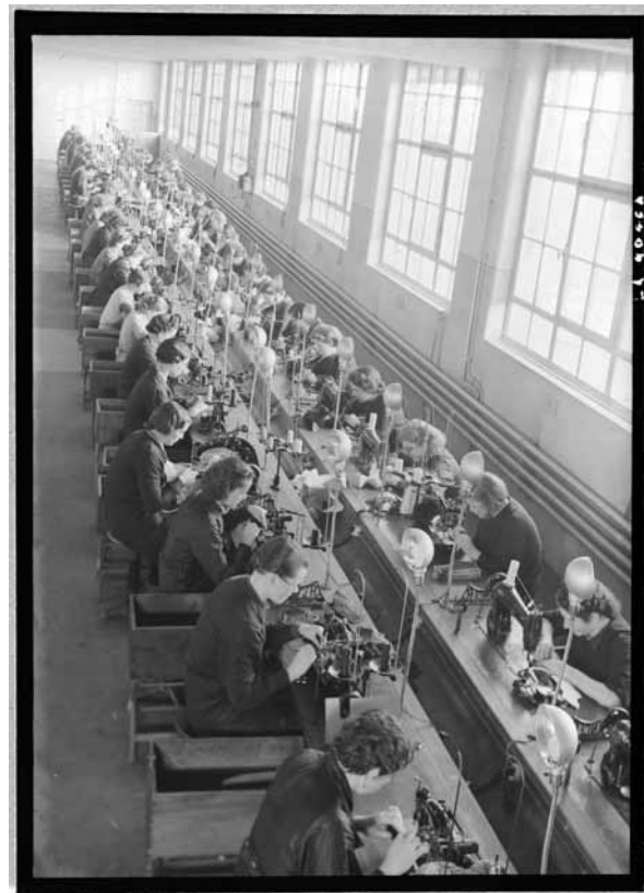
Couturières, vers 1940