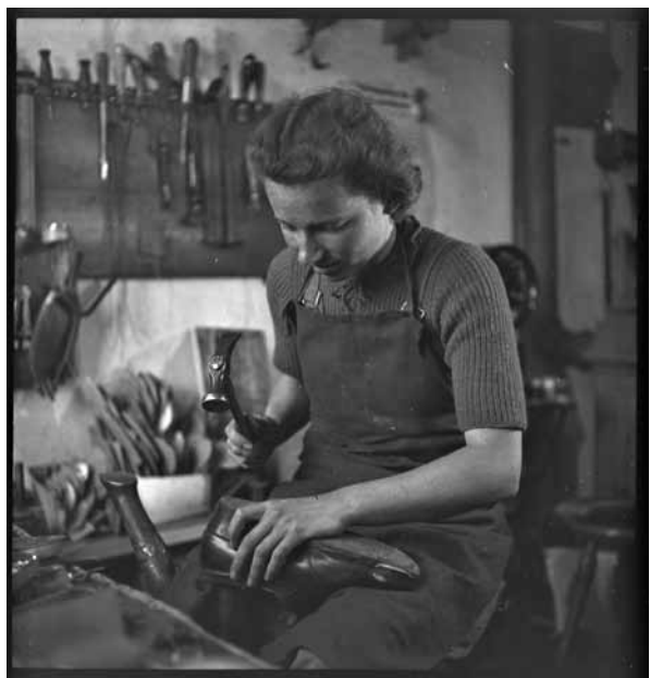
La première cordonnrière de Suisse, 1944, Lachen (SZ)