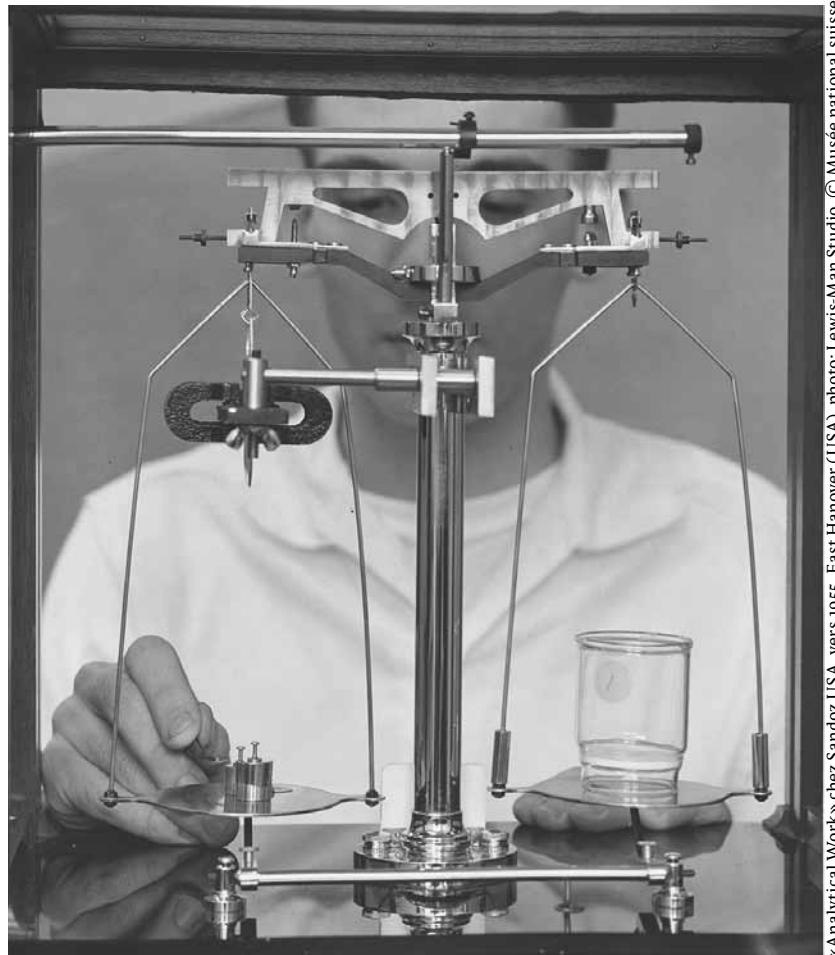
«Analytical Work» chez Sandoz USA, vers 1955, East Hanover (USA), photo: Lewis-Mann Studio. © Musée national suisse