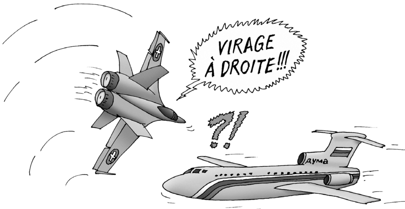
Au lendemain des élections fédérales, un F/A-18 importune l'avion du président de la Douma