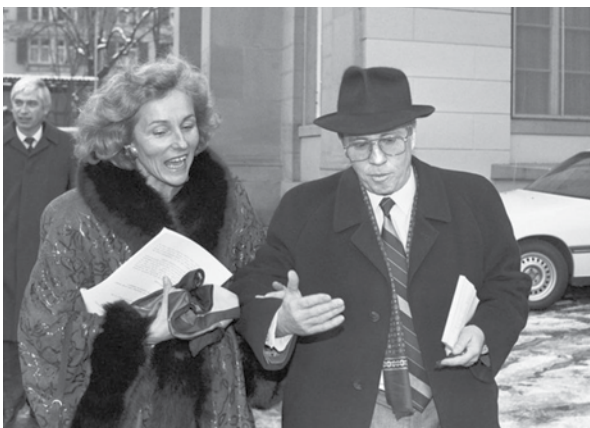
Demander à un milliardaire de nous expliquer l'aide sociale? Quelle «#Sozialirrsinn»!

La question des «entreprises sociales» est plus compliquée. Du point de vue même de la gauche, il existe de bonnes raisons de s'opposer à une politique sociale qui se concentre sur l'«employabilité». En même temps, l'existence de réelles réussites de réintégration sur le marché du travail ne fait pas de doute. Le but de l'UDC est en réalité de souiller tout ce qui a trait à l'État social. En s'en prenant à l'«industrie du social», l'UDC ne cherche pas à accroître