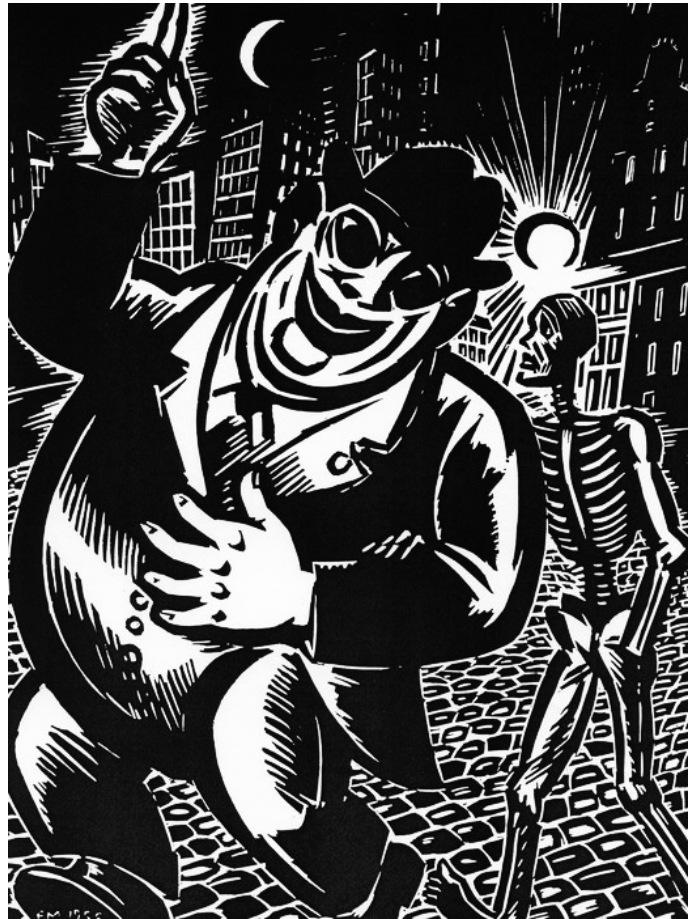
Gravure sur bois de Frans Masereel