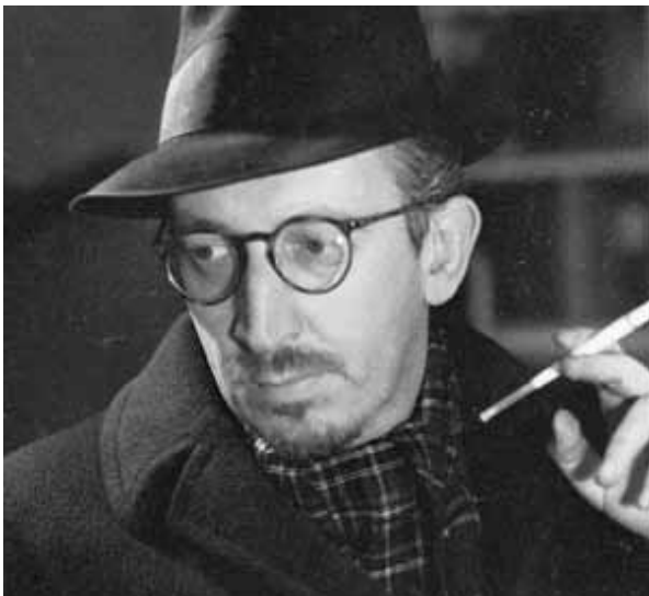
Dwight Macdonald (1906-1982)

À lire: Dwight Macdonald, Le socialisme sans le progrès , La lenteur , 2011; Une tragédie sans héros . Essais critiques sur la politique, la guerre et la culture, Editions de l'encyclopédie des nuisances , 2013.